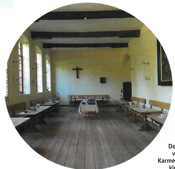
De refter van het Karmelietenklooster.