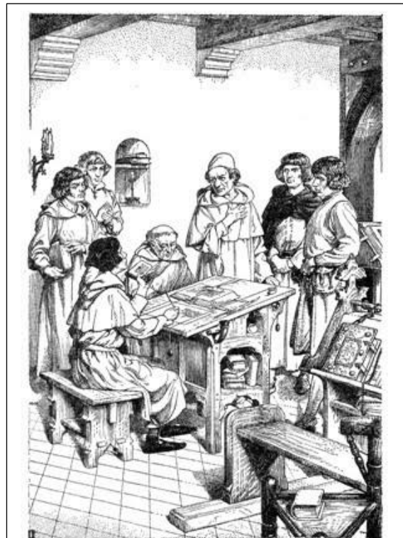
Geert Grote temidden van zijn leerlingen

Geert Grote stierf in 1384 in Deventer, amper 44 jaar oud. Ondanks zijn korte leven, heeft Geert Grote een indrukwekkende erfenis nagelaten. Na zijn dood zetten zijn vrienden en volgelingen zijn werk verder. De Moderne Devotie werd een van de meest invloedrijke initiatieven uit de geschiedenis van de Nederlanden.