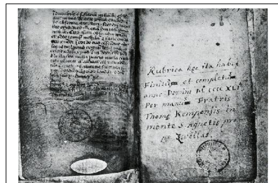
Het manuscript van De Imitatione Christi. Koninklijke Bibliotheek, Brussel.

Hij ontpopte zich als een buitengewoon productieve schrijver. Hij kopieerde de Bijbel zeker vier keer en schreef ook zelf talrijke devotieele werken in het Latijn: traktaten, meditaties, brieven en preken. Rond 1420 begon hij met het verzamelen van inspirerende teksten en invallen, die hij noteerde in een opschriftboekje of 'rapiarium'. Gaandeweg werd dit de basis van zijn boek 'De imitatione Christi'.