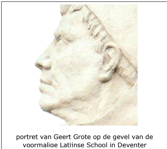
portret van Geert Grote op de gevel van de voormalige Latijnse School in Deventer

De Moderne Devotie is een beweging van innerlijke vernieuwing die aan het eind van de veertiende eeuw ontstond. Grondlegger van de beweging was Geert Grote .